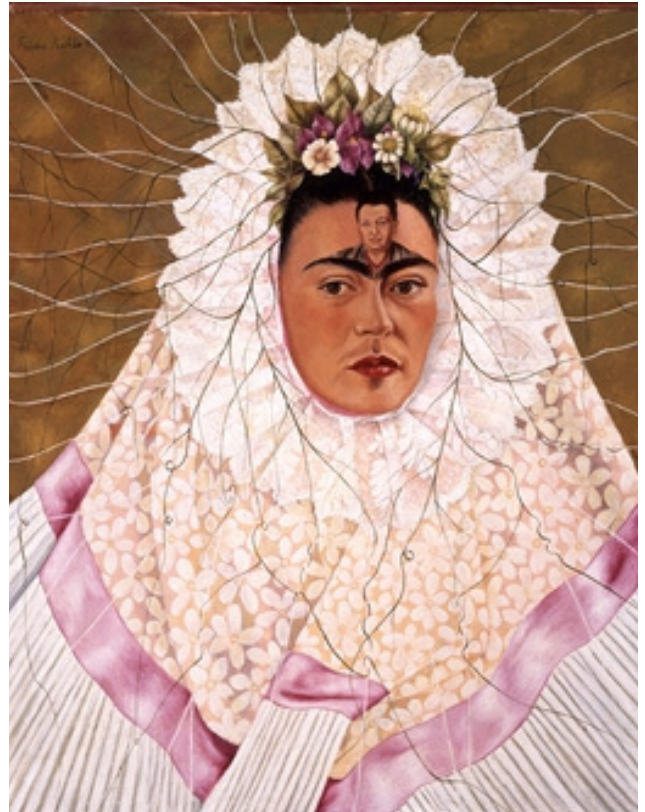
Frida Kahlo autoritratto come Tehuana, 1943

Per Frida tutto è colore, il colore la circonda, la ama, la protegge come un talismano contro l'arroganza di un destino che troppo spesso decide per noi.