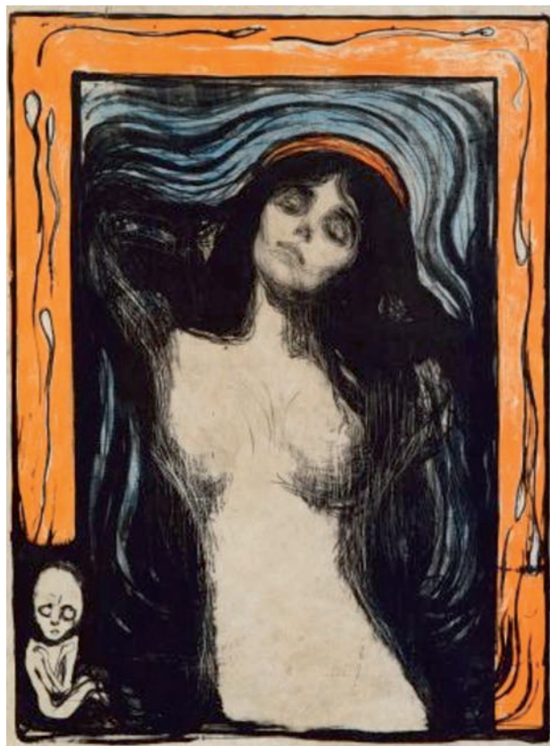
Edvard Munch. Madonna. 1895

La grande mostra di Palazzo Ducale, visitabile sino al 27 aprile 2014, ripercorre attraverso un centinaio di opere la complessa parabola creativa del Maestro norvegese cercando di mettere in risalto gli aspetti più lirici e distesi, intimi e pacificati della sua copiosa produzione di pittore e incisore.